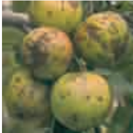
Pedrado em macieira ( Venturia inaequalis )